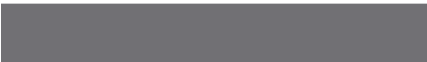
HARMAA PANTONE Cool Gray 11C / K 79 / #4E4F53